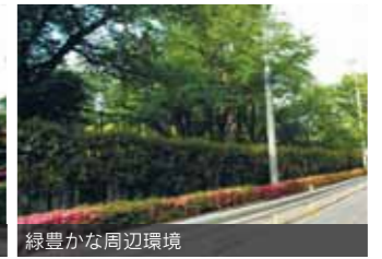
緑豊かな周辺環境