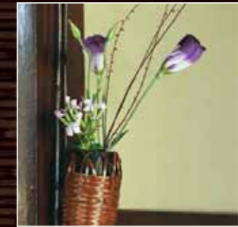
モデルプラン#02「茶室のある家」